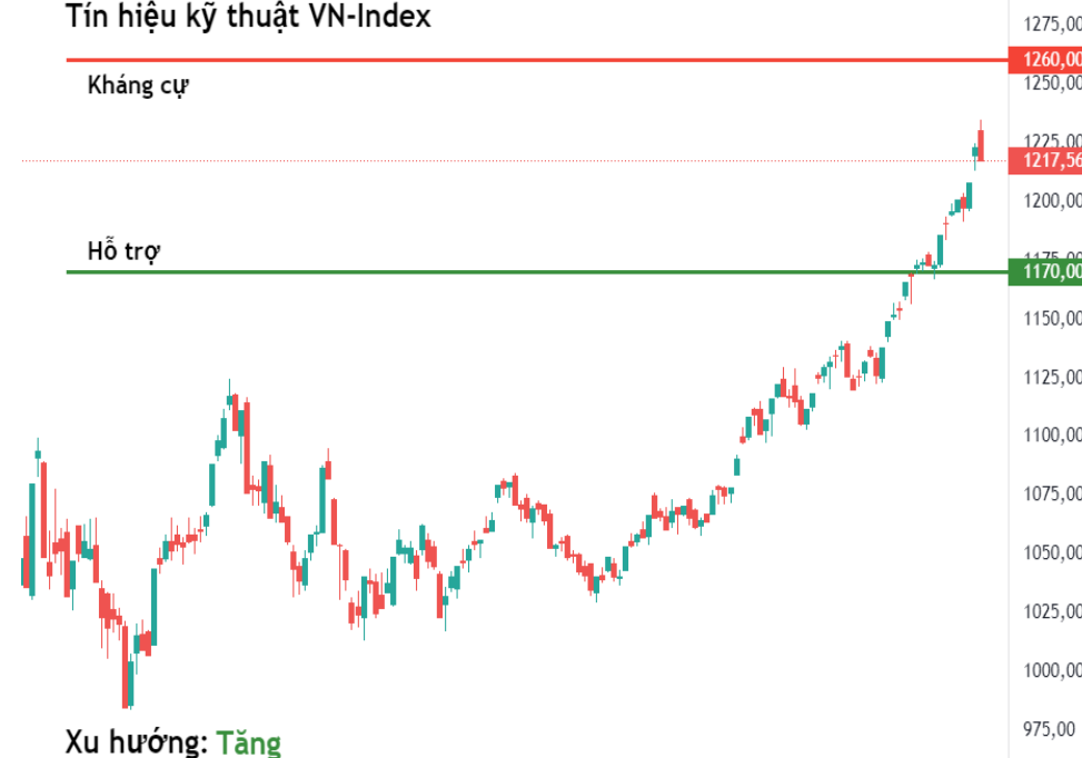
Tín hiệu kỹ thuật VN-Index